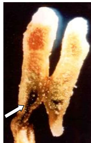
Figura 2. Nódulos de alfalfa ( Medicago sativa L.). La flecha indica el área donde inicia la senescencia nodular.