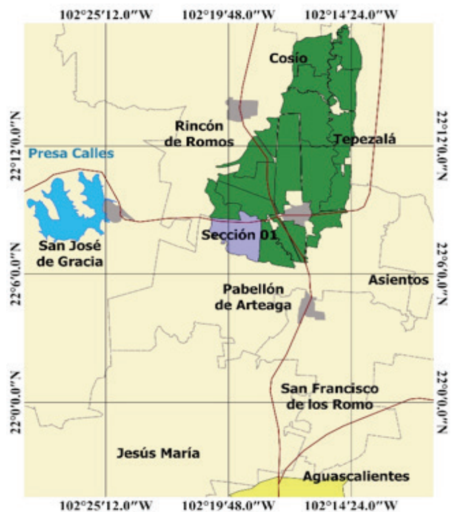
Figura 1. Localización de la sección 01 del DR 001, Pabellón de Arteaga, Aguascalientes.

Se rediseño y optimizo la sección 01 (Figura 1) presurizada y en operación, del DR 001 Pabellón de Arteaga, Aguascalientes, ubicado a 35 km al norte de la ciudad de Aguascalientes, en los municipios de Pabellón de Arteaga, Rincón de Romos y Tepezalá.